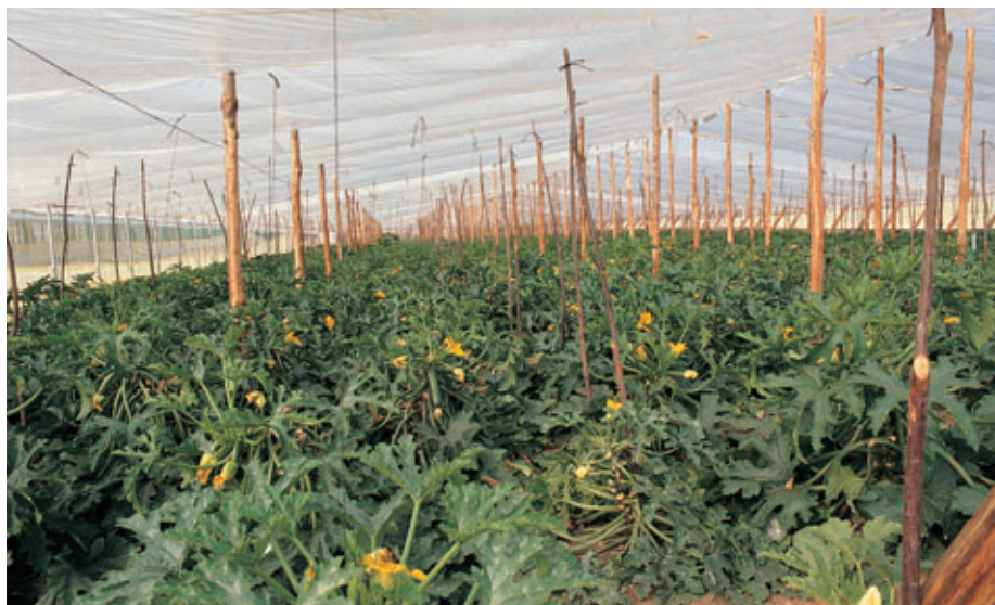
La innovación tecnológica rentabiliza la agricultura. Cultivos bajo plásticos en la Región de Murcia.